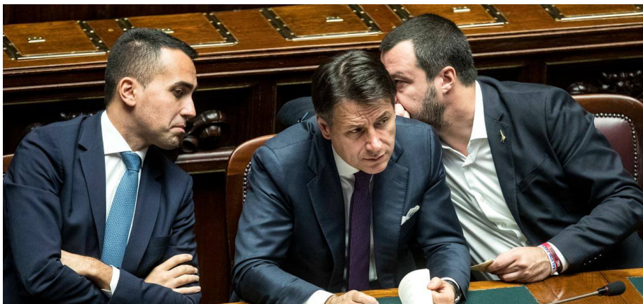
Luigi Di Maio, Giuseppe Conte e Matteo Salvini

15.03.2019, agg. alle 17:05 - int. Roberto Bin